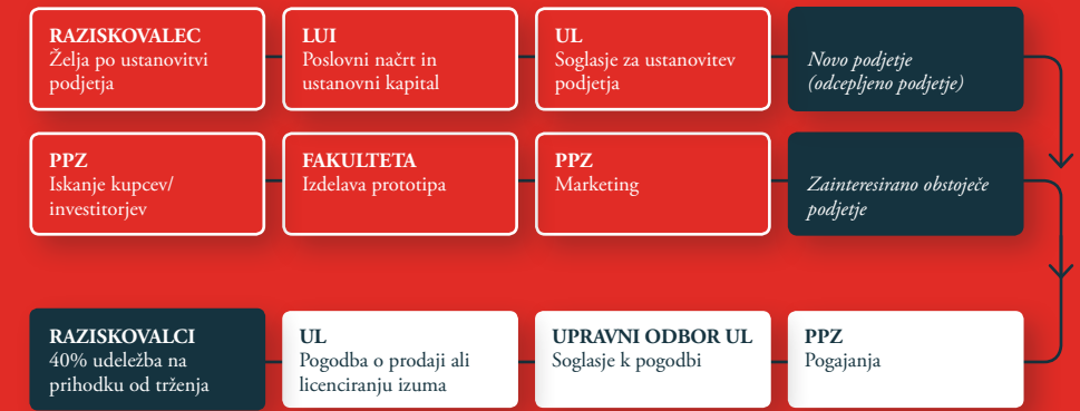
Proces trženja službenih izumov na Univerzi v Ljubljani

Trženje izuma oziroma know-howa je kompleksen proces, v katerem ima ključno vlogo dobro sodelovanje med izumiteljem in PPZ. Ta pomaga pri trženju predvsem s spodnjimi aktivnostmi: