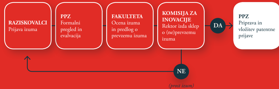
Postopek prevzema službenega izuma na Univerzi v Ljubljani

O vsakem izumu, k nastanku katerega je pripomogla oseba, ki je v delovnem razmerju na Univerzi v Ljubljani oziroma je z njo v drugem pogodbenem razmerju (gostujoči učitelj, sodelavci na projektih, ...) kot tudi študent, če gre za rezultat njegovega dela pri izvajanju študijskih obveznosti na Univerzi v Ljubljani oziroma je pri tem uporabljal sredstva Univerze v Ljubljani, je potrebno skladno s Pravilnikom o upravljanju s pravicami industrijske lastnine na Univerzi v Ljubljani obvestiti PPZ na obrazcu za prijavo izuma. Izumitelj v tem primeru ne sme sam pravno zavarovati ali tržiti izuma oziroma potencialne inovacije, ker je slednja last Univerze v Ljubljani. Pomembno je tudi, da pred dnem vložitve prijave za pridobitev pravice ne pride do razkritja javnosti oziroma razkritja nepoblaščenim osebam.